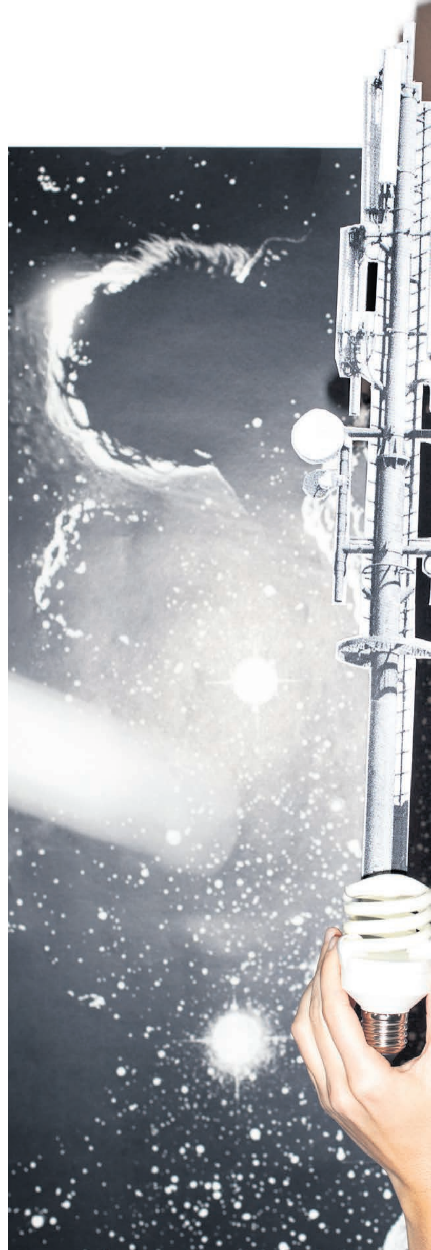
Völlig verstrahlter Haushalt: Auch Stromsparlampen, schnurlose Telefone und