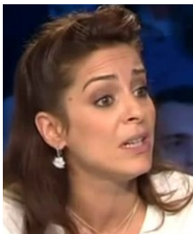
Sie ist schädlich, diese Strahlung

Laurent Ruquier, Präsentator (Bild oben, Mitte) liest die Sprechblasen einer auf dem Podium präsentierten Karikatur (→) aus dem Magazin Marianne vor: