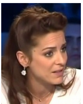
Ich bin elektrohypersensibel geworden

Audrey Dana, Schauspielerin: „Nein, für mich ist das eben ein Riesenwitz; es ist doch offensichtlich gefährlich. Wie soll ich sagen... sie sind schädlich, diese Funkwellen; ich erlaube mir das zu sagen, und man wird mich vielleicht für verrückt halten – ich pfeife darauf. Aber... während des ersten Drittels meiner zweiten Schwangerschaft, das war vor vier oder fünf Jahren, damals gab es schon überall viele, viele Mobiltelefone; man weiß, dass die Frauen, wenn sie im ersten Drittel sind, im Allgemeinen keinen Kaffee mehr trinken, keinen Alkohol mehr trinken.... sie können nicht ausstehen, was schädlich ist. Ich ertrug das Mobiltelefon nicht mehr, ich ertrug das Internet nicht mehr; ich konnte kein Handy mehr in meiner Nähe haben – wirklich! Es machte mich k r a n k ! Ich bin also elektrohypersensibel geworden, derart stark, im ersten Drittel.... Das ging dann vorüber; ich behielt eine ganz leichte Sensibilität. Aber heute weiß ich, dass da etwas dran ist; ich weiß, dass es schädlich ist, weil.... weil.... eben, das Baby da drin sagte mir: Geh auf Abstand! Also wenn ich höre, wie uns die Studien sagen, dass.... – und ich höre dahinter: Kauft, kauft, macht weiter so mit konsumieren , – dann glaube ich das keinen Augenblick!